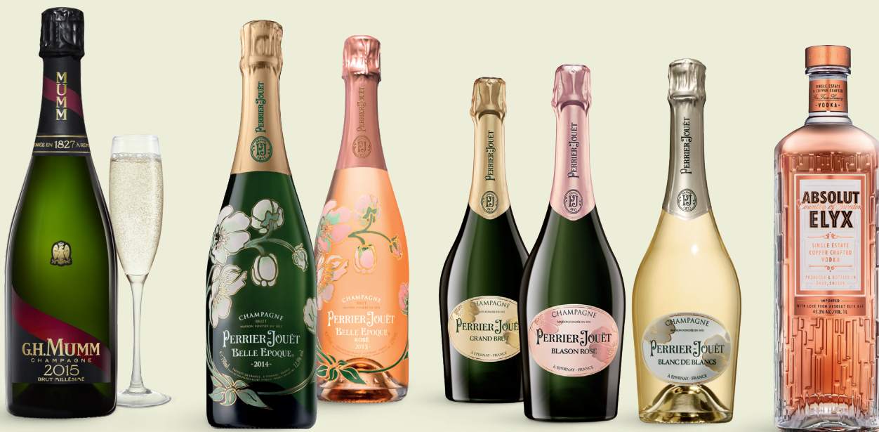
Mumm Millésimé 2015 1050011 – 450,40 kr (sid 20)