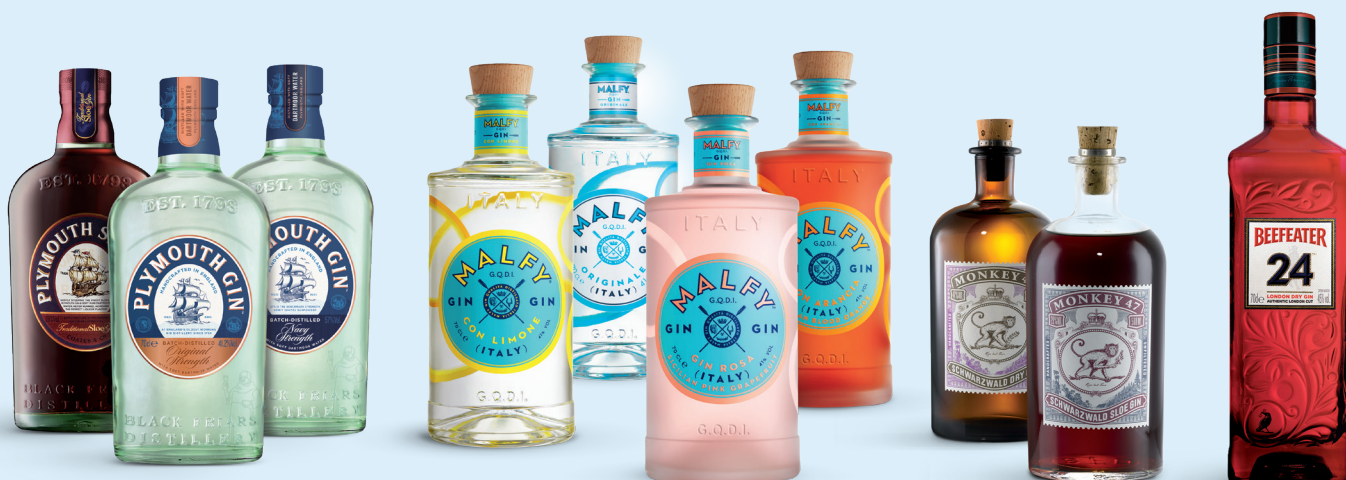
Plymouth Sloe Gin 1050510 – 224,50 kr (sid 58) Plymouth Gin 1050109 – 303,10 kr (sid 58) Plymouth Gin Navy Strength 1050828 – 339,50 kr (sid 58)