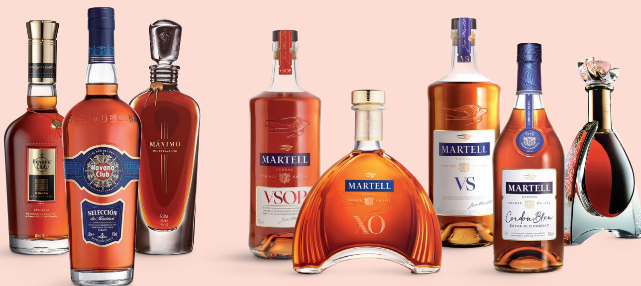
Havana Club Unión 1050332 – 2971,80 kr (sid 79) Havana Club Selección de Maestros 1050043 – 377,70 kr (sid 79)