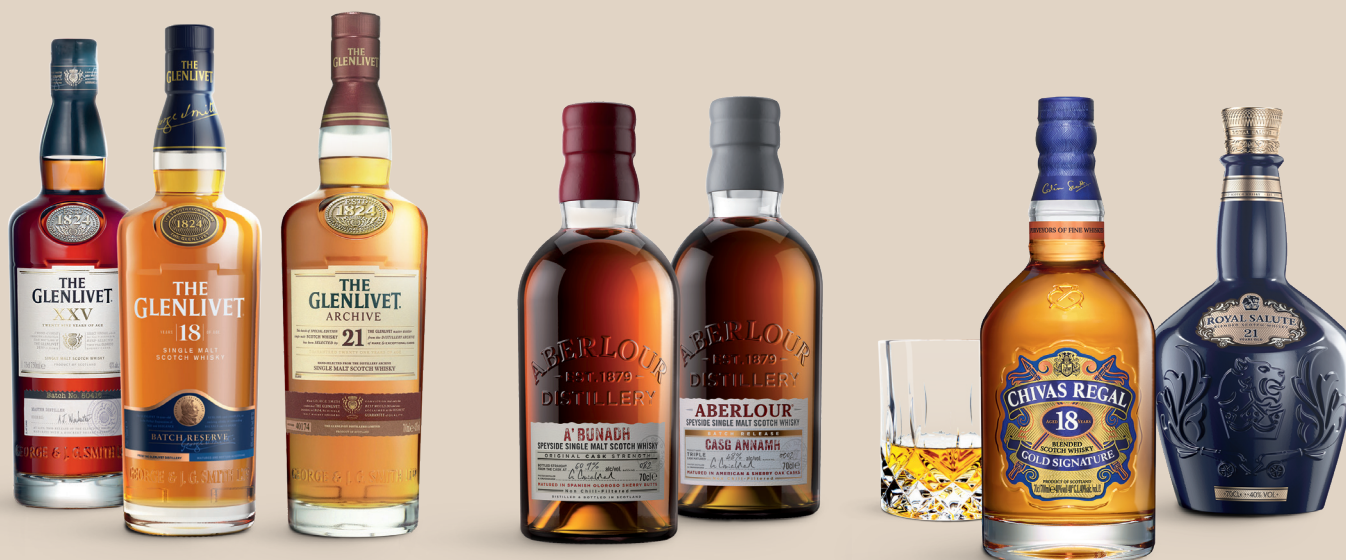
The Glenlivet XXV 25 yo 1050521 – 4078,30 kr (sid 62)