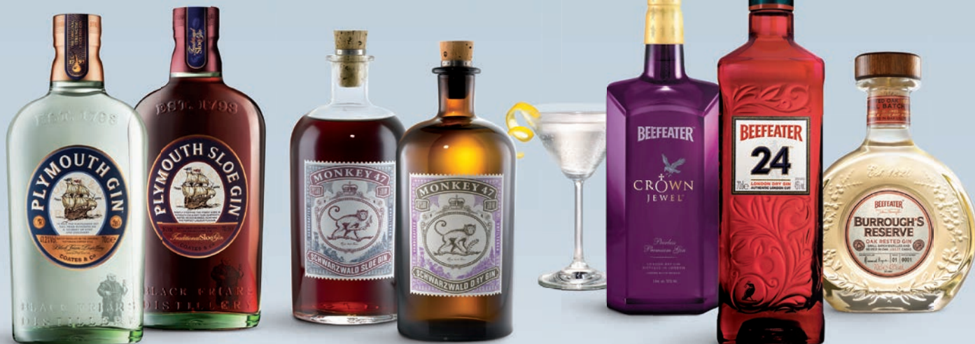
Plymouth Gin Nr 1050109 – 303,10 kr