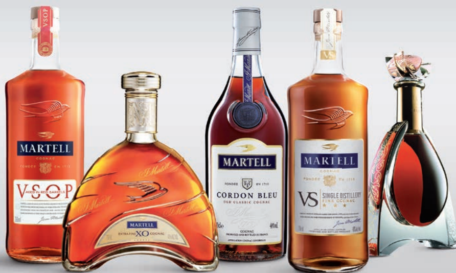
Martell VSOP Red Barrel Nr 1050577 – 641,40 kr