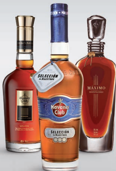
Havana Club Unión Nr 1050332 – 2.667,20 kr