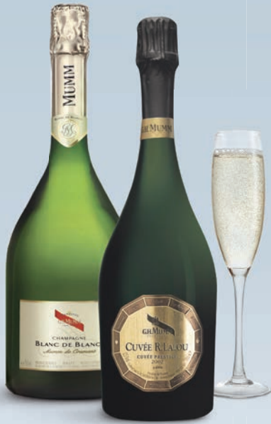
Mumm Blanc de Blancs de Cramant Nr 1007342 - 658,70 kr Mumm R. Lalou 2002 Nr 1007340 - 1.110,90 kr