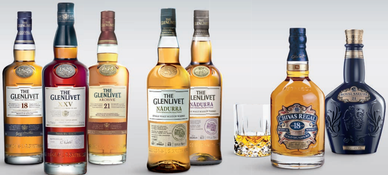
The Glenlivet 18 yo Nr 1017058 - 629,55 kr The Glenlivet XXV 25 yo Nr 1050521 - 3340,00 kr