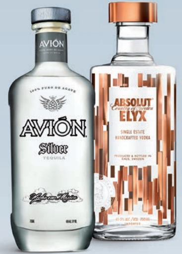
Avión Silver Tequila Nr 1050388 - 516,30 kr Absolut Elyx Nr 1050205 - 485,40 kr