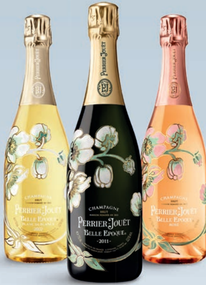
Perrier-Jouët Belle Epoque Blanc de Blancs 2004 Nr 1050420 - 2.762,20 kr Perrier-Jouët Belle Epoque Vintage 2011 Nr 1050468 - 1.193,10 kr Perrier-Jouët Belle Epoque Rosé Vintage 2006 Nr 1007345 - 1.978,50 kr