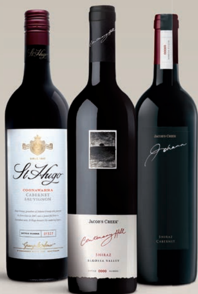
St Hugo Coonawarra Cabernet Sauvignon Nr 1016748 - 283,70 kr Jacob's Creek Centenary Hill Shiraz Nr 1016701 - 280,80 kr Jacob's Creek Johann Shiraz Cabernet Nr 1016708 - 426,50 kr