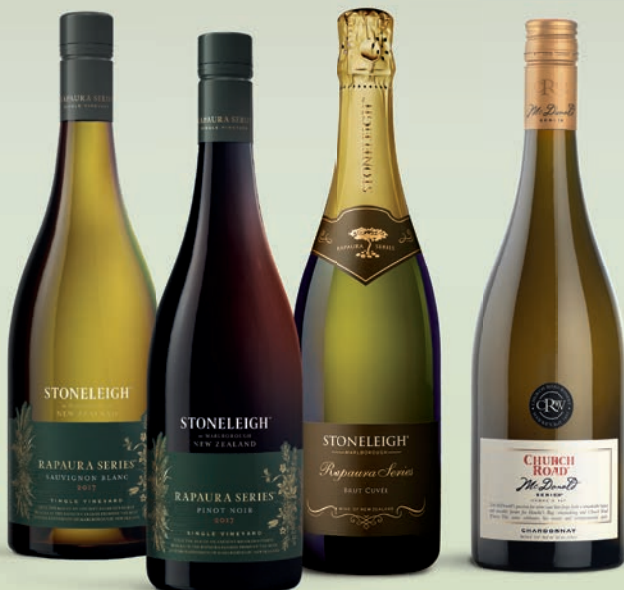
Stoneleigh Rapaura Sauvignon Blanc Nr 1050142 - 135,10 kr