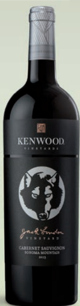
Kenwood Jack London Cabernet Sauvignon Nr 1050432 - 213,20 kr