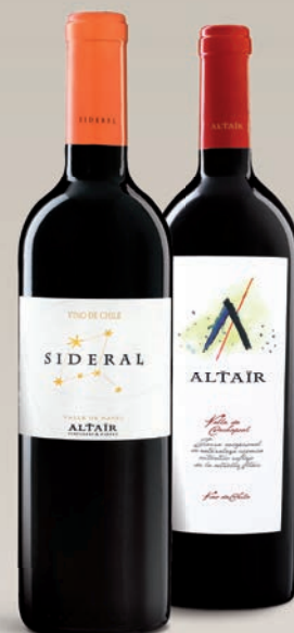
Sideral Nr 1050186 - 163,70 kr Altair Nr 1050068 - 474,10 kr