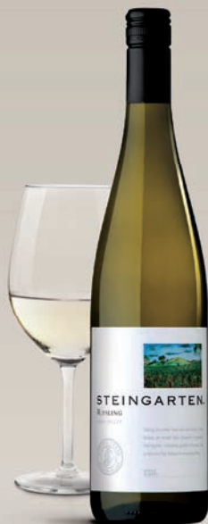
Jacob's Creek Steingarten Riesling Nr 1007259 - 218,00 kr