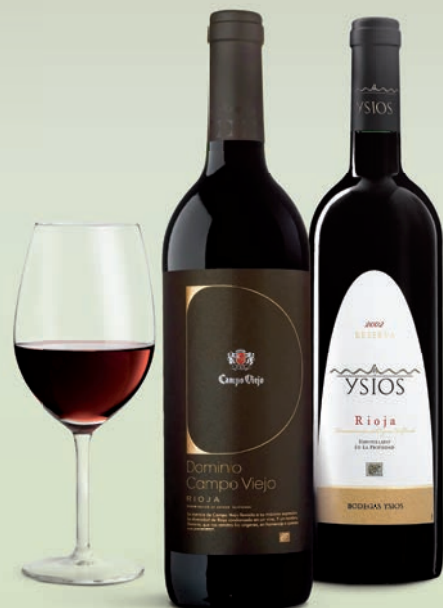
Dominio de Campo Viejo Rioja Nr 1016581 - 193,20 kr