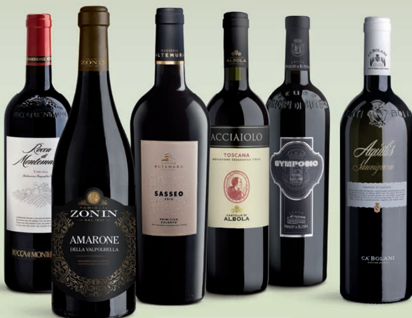
Rocca di Montemassi Maremma Toscana Nr 1050256 - 268,40 kr Zonin Amaronone Della Valpolicella Nr 1050483 - 294,80 kr Masseria Altemura Sasseo Primitivo Nr 1050257 - 113,20 kr