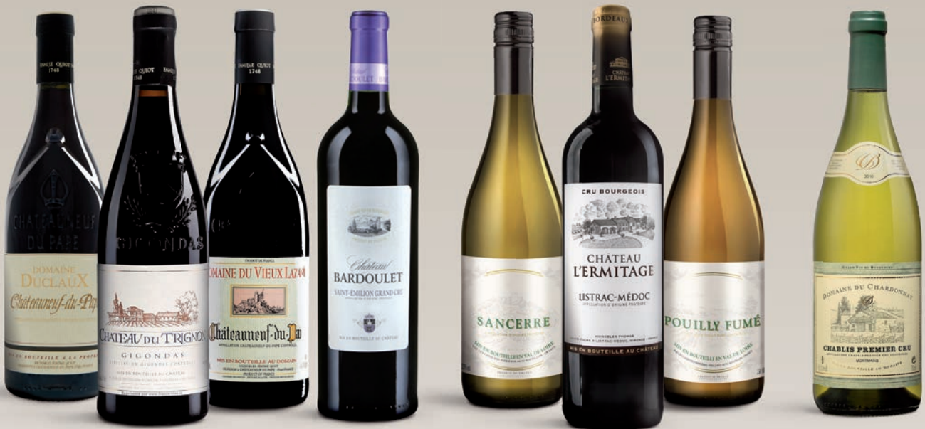
Domaine Duclaux Châteauneuf-du-Pape Nr 1050422 - 230,40 kr