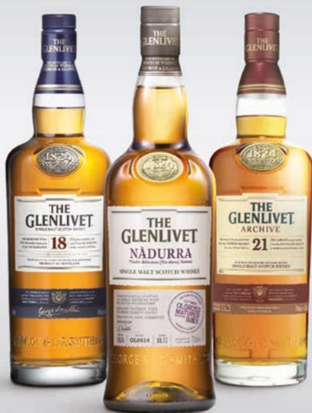
The Glenlivet 18 yo Nr 1017058 - 629,55 kr The Glenlivet Nàdurra Oloroso Nr 1050371 - 433,20 kr The Glenlivet Archive 21 yo Nr 1007355 - 1.217,70 kr