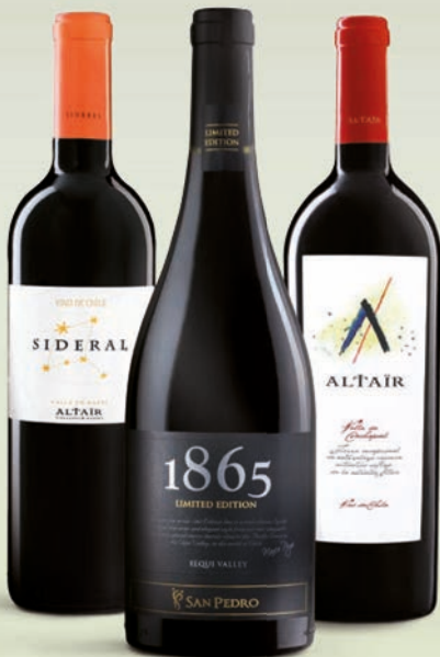
Sideral Cabernet Sauvignon Nr 1050186 - 163,70 kr Altair Cabernet Sauvignon Nr 1050068 - 474,10 kr 1865 Syrah Limited Edition Nr 1050052 - 224,90 kr