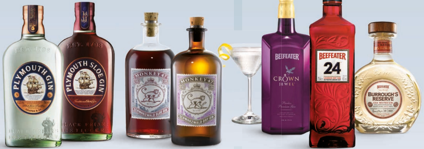
Plymouth Gin Nr 1050109 – 303,05 kr