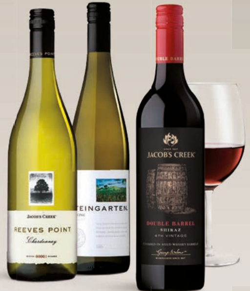
Jacob's Creek Reeves Point Chardonnay Nr 1007260 - 217,95 kr Jacob's Creek Steingarten Riesling Nr 1007259 - 217,95 kr Jacob's Creek Double Barrel Shiraz Nr 1050440 - 135,10 kr