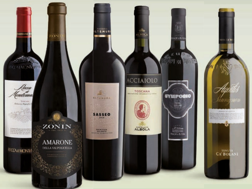
Rocca di Montemassi Maremma Toscana Nr 1050256 - 267,30 kr Zonin Amarone Della Valpolicella Nr 1050483 - 292,50 kr Masseria Altemura Sasseo Primitivo Nr 1050257 - 111,20 kr Castello d'Abola Acciaio Nr 1050245 - 330,30 kr Feudo Principi di Butera Symposio Nr 1050258 - 219,35 kr Tenuta Ca' Bolani Aquilus Sauvignon Nr 1050265 - 220,30 kr