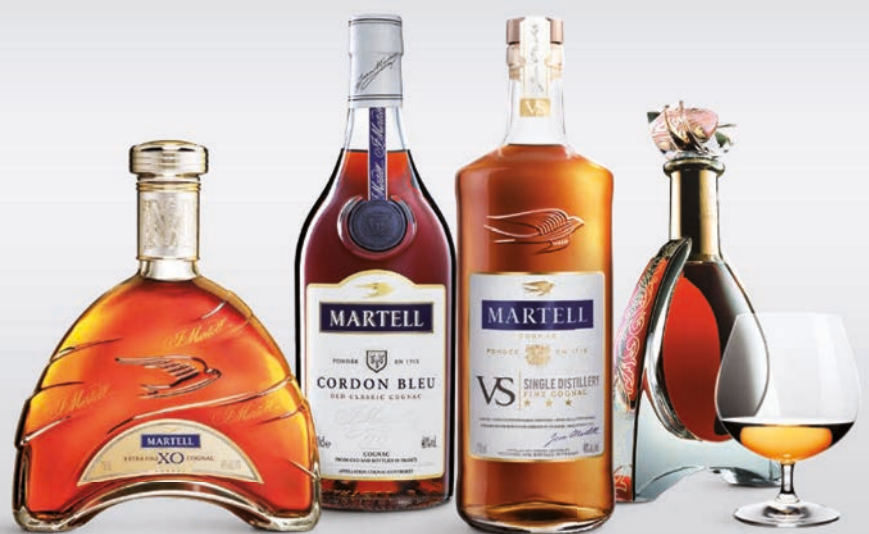
Martell XO Nr 1016853 – 1.413,80 kr