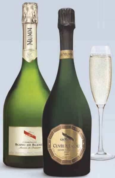
Mumm Blanc de Blancs de Cramant Nr 1007342 - 658,70 kr Mumm R. Lalou 2002 Nr 1007340 - 1.110,90 kr