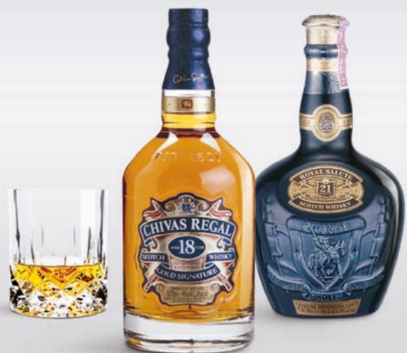
Chivas Regal 18 yo Nr 1016614 - 593,20 kr Royal Salute 21 years old Nr 1007349 - 1.220,90 kr