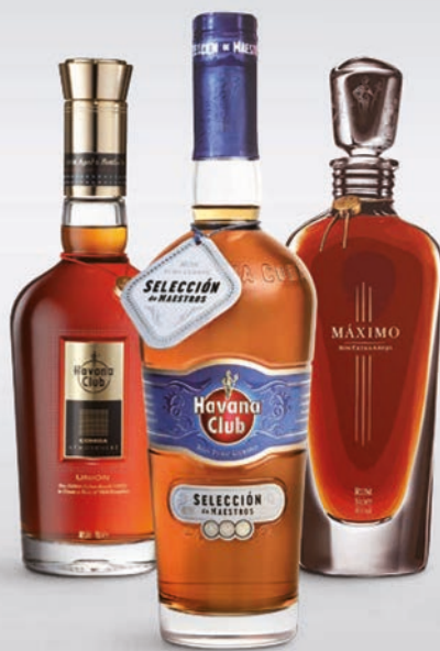
Havana Club Unión Nr 1050332 – 2.667,20 kr