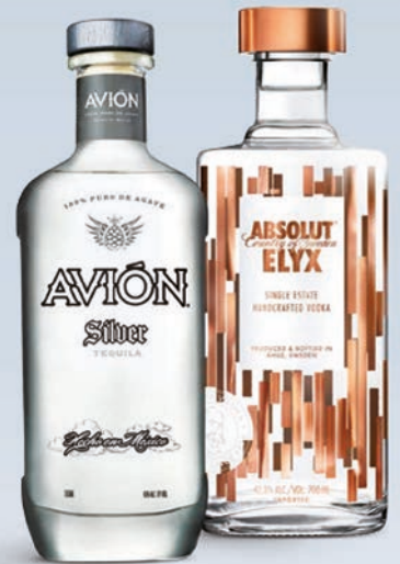
Avión Silver Tequila Nr 1050388 - 516,30 kr Absolut Elyx Nr 1050205 - 485,40 kr