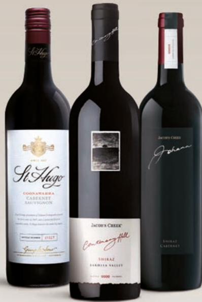
Jacob's Creek St Hugo Coonawarra Cabernet Sauvignon Nr 1016748 - 283,70 kr Jacob's Creek Centenary Hill Shiraz Nr 1016701 - 280,80 kr Jacob's Creek Johann Shiraz Cabernet Nr 1016708 - 426,50 kr