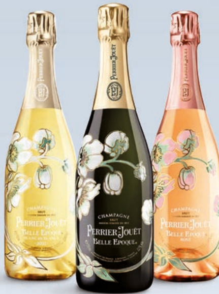
Perrier-Jouët Belle Epoque Blanc de Blancs 2004 Nr 1050420 - 2.762,20 kr Perrier-Jouët Belle Epoque Vintage 2008 Nr 1007343 - 1.106,30 kr Perrier-Jouët Belle Epoque Rosé Vintage 2006 Nr 1007345 - 1.978,50 kr